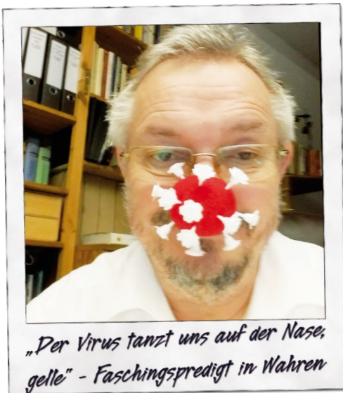
„Der Virus tanzt uns auf der Nase, gelle“ - Faschingspredigt in Wahren

In den vergangenen Monaten hat unter aktuellen Eindrücken eine Begriffsverschiebung stattgefunden. Betroffen ist davon ein uraltes Phänomen, nämlich die Annahme von verschwörerischen Aktivitäten kleiner Gruppen zu illegalen, verwerflichen oder schädlichen Zwecken zur Erklärung von komplexen, unbeherrschbaren Zusammenhängen. Die unterschiedlichen Ausprägungen dieses Phänomens wurden bisher meist unter dem Begriff Verschwörungstheorie zusammengefasst. Während der besonderen Präsenz durch die globale Corona-Pandemie und die politische Krise in den USA hat sich die Bezeichnung als zu nah an wissenschaftlichen Theorien erwiesen. Die missverständliche begriffliche Nähe macht es allzu leicht, nicht nur „alternative Fakten“ neben tatsächlichen Fakten zu postulieren, sondern auch Verschwörungshypothesen in einer ähnlichen epistemischen Position wie wissenschaftliche Theorien zu begreifen.