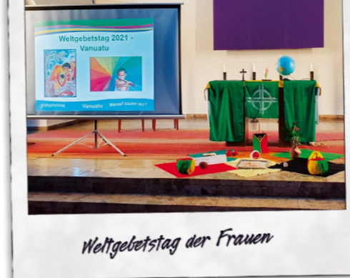
Weltgebetstag der Frauen

Als Standbild steht der Heilige Josef in vielen Kirchen und Kapellen und hat seinen Platz an der Krippe. Meistens ist Josef im Hintergrund oder einer Seitennische. Seine schützende und väterliche Haltung ist unverkennbar. Doch stellen wir fest, dass wir wenig über ihn wissen. Er spricht im Lukasevangelium kein Wort, kein einziges Wort ist von ihm überliefert. Josef ist nicht bekannt geworden durch das, was er gesagt hat, sondern durch das, was er getan hat. Viermal schickt Gott einen Boten zu ihm, um ihm im Traum seine Weisung mitzuteilen. Josef hört schweigend die Botschaft des Engels, dass Maria, seine Verlobte, ein Kind erwartet durch das Wirken des Heiligen Geistes. Josef ist in diesem Augenblick ganz Ohr für die Botschaft des Engels. Schweigend nimmt er die Botschaft an und steht zu Maria und dem Kind. Er verstößt sie nicht. Nach jüdischem Gesetz wäre Maria zum Tode verurteilt worden. Er sagt Ja zu seiner Berufung, zu Maria, zu dem Kind. Diese und die weiteren Weisungen erfüllt er im Vertrauen auf Gottes Führung. Er hört und schweigt, fragt nicht zurück, was mehr als verständlich gewesen wäre. Sein Hören ist das Hören in die Stille hinein, aus der er Gottes Ruf vernimmt. Josef ist ein Heiliger, der ein offenes Ohr hat, der um die Bedeutung des Wortes weiß, ebenso aber um die Kunst des Hörens und des Schweigens. Aus dem Hören