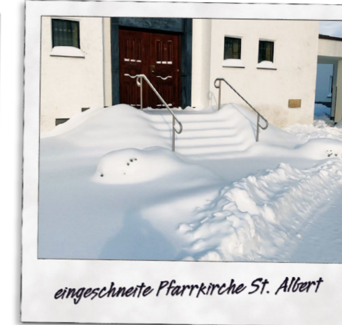
eingeschneite Pfarrkirche St. Albert

Viele Darstellungen zeigen Josef als Arbeiter. Oft wird er als Zimmermann oder Tischler dargestellt, mit Hammer, Säge oder Hobel in der Hand. Das sind seine Attribute. Er ist im wahrsten Sinne des Wortes Handwerker und ein Patron der Handwerker. Manche Vereine und Handwerkhäuser tragen deshalb seinen Namen. Manchmal wird sogar Jesus als Kind dargestellt, der bei seinem Pflegevater das Handwerk des Tischlers erlernt. Der Namens-tag des Heiligen Josef ist der 19. März. Papst Pius XII fügte 1955 einen zweiten Festtag hinzu: den 1. Mai als Fest des Heiligen Josefs, des Arbeiters. Dazu passt auch ein großes Josefsmonument vor der Josefs-