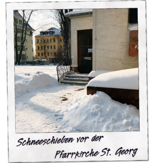
Schneeschieben vor der Pfarrkirche St. Georg

Meines Erachtens ist die Kernfrage: Wenn die Glaubens- und Moral-Lehre der Kirche mit dem nicht übereinstimmt, was ihre Mitglieder glauben und leben – ist das nur ein Problem der Vermittlung (von oben nach unten)? Des zu schwachen Widerstands gegen den „Zeitgeist“? Oder müssen stellenweise nicht auch Katechismus und Kirchenrecht auf den Stand der kulturellen Errungenschaften gebracht werden, an denen wir alle zusammen teilhaben? Kirche hat dies immer wieder getan! Doch bei vielen hat sich Nostalgie breit gemacht oder eine unklare Vorstellung von „ewigen Wahrheiten“ festgesetzt. Christentum ist aber kein System von Sätzen und Regeln, sondern ständige Suche nach Gott, Leben mit Christus