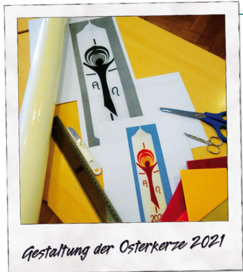
Gestaltung der Osterkerze 2021

10:00 Fußballturnier der Pfarrei (St. Albert)