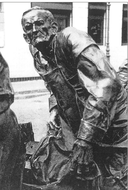
Monument vor der Josefskirche im Düsseldorfer Stadtteil Oberbilk: Josef als typischer Stahlarbeiter inmitten der anderen Stahlarbeiter. Es bringt zum Ausdruck, dass Kirche und Arbeiter zusammengehören.

Der Heilige Josef, ein Heiliger im Hintergrund, ein Heiliger im Schatten der Gottesmutter Maria, ein Heiliger, den es zu entdecken gilt. Wir wissen wenig über ihn, lediglich der Evangelist Lukas berichtet über ihn. Er ist ein stiller Heiliger. Dazu passt das „Jahr des heiligen Josefs“, das Papst Franziskus am 8. Dezember 2020 ausgerufen hat. Fast unbemerkt der Öffentlichkeit ist dieses Jubiläum eröffnet worden. Das Datum ist bewusst gewählt, denn vor 150 Jahren, am 8. Dezember 1870, wurde Josef zum Schutzpatron der katholischen